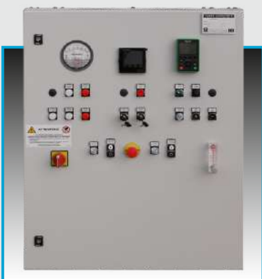
Quadro elettrico / Control console

(*) In collaborazione con/ In cooperation with GORE REMEDIA